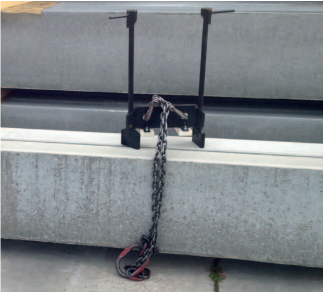
Gesamtansicht mit Kette

Die Entladung kann mit dem leihweise erhältlichen Versetzgehänge erfolgen. Hierzu werden zwei Haken mit Kette (nicht im Lieferumfang enthalten) in die vorgesehenen Aussparungen gehängt und die beiden Füße des Versetzgehanges in der Schlitzrinne platziert (Schritt 1). Es sollte sich möglichst genau in der Mitte der Rinne befinden, um für eine optimale Lastverteilung und Schwerpunkt zu sorgen. Anschließend wird das Versetzgehänge langsam angehoben, wodurch sich die beiden Trägerstangen um 90° nach außen drehen. Das Versetzgehänge ist nun verriegelt und kann die zu tragende Last sicher aufnehmen (Schritt 2).