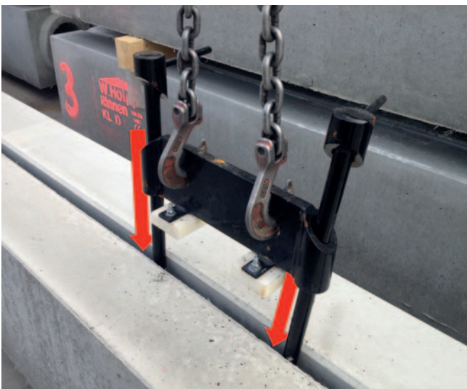
▲ Schritt 1

Die Entladung kann mit dem leihweise erhältlichen Versetzgehänge erfolgen. Hierzu werden zwei Haken mit Kette (nicht im Lieferumfang enthalten) in die vorgesehenen Aussparungen gehängt und die beiden Füße des Versetzgehanges in der Schlitzrinne platziert (Schritt 1). Es sollte sich möglichst genau in der Mitte der Rinne befinden, um für eine optimale Lastverteilung und Schwerpunkt zu sorgen. Anschließend wird das Versetzgehänge langsam angehoben, wodurch sich die beiden Trägerstangen um 90° nach außen drehen. Das Versetzgehänge ist nun verriegelt und kann die zu tragende Last sicher aufnehmen (Schritt 2).