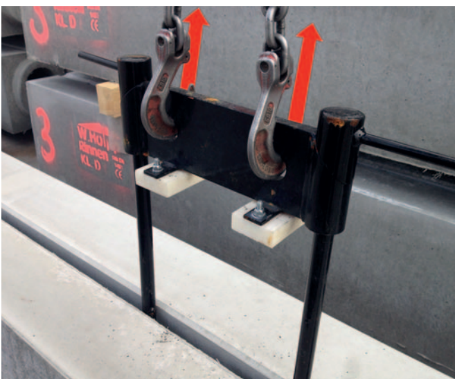
Schritt 2 ▼

Alternativ kann die Entladung mittels Bagger/ Radlader und einer Palettengabel erfolgen, die Produkte werden auf Euro-Paletten bzw. Kanthölzern angeliefert. Hier ist darauf zu achten, dass keinerlei Ecken oder Kanten beschädigt werden.